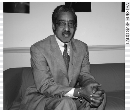
Candidato visita a redação do EXTRA

Nasceu em Washington D.C e se mudou para Newark com quatro meses de idade, onde estudou até ter 18 anos. Foi para a Stanford University (na Califórnia) e se formou em Ciências Políticas com mestrado em Sociologia. Mudou-se para a Inglaterra por dois anos onde estudou História Moderna na Universidade de Oxford. De volta ao EUA, estudou Direito em Yale, no estado de Connecticut. Booker mora em Newark desde 1995, sua família vive na cidade desde a década de 40.