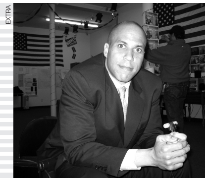
O candidato Cory Booker, em seu comitê central