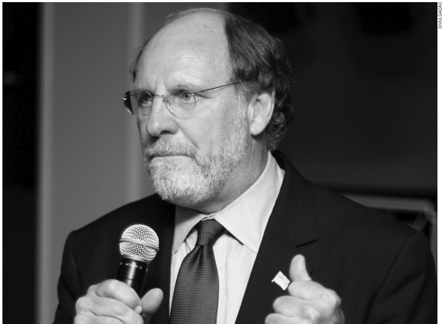
O governador de New Jersey, Jon Corzine, declarou paralização estadual diante da dificuldade de acordo do orçamento anual, no dia 1º de julho

New Jersey já perdeu o prazo de apresentação da receita anual três vezes durante os últimos cinco anos. Entretanto, nenhum governante apelou para o artigo na Constituição de proibir gastos públicos.